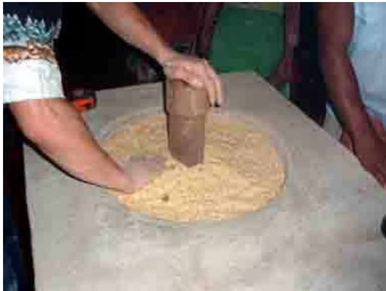
Cargando y apelmazando la cascarilla de café