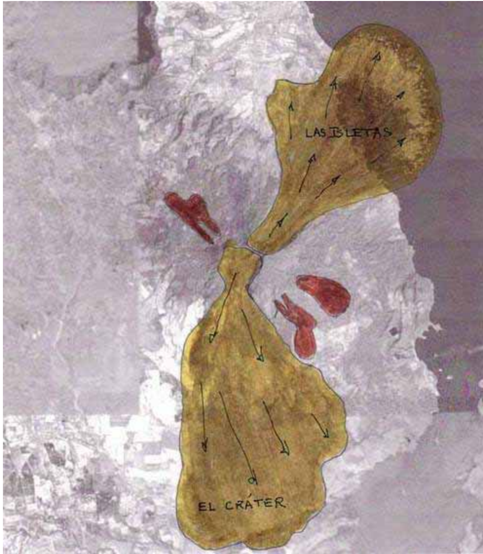
Avalanchas del volcán Mombacho (amarillo); los flujos recientes de lava en anaranjado. La ciudad de Granada esta justo en el centro superior del grabado, y la Laguna de Apoyo en la esquina superior izquierda. Adaptado de mapa del Servicio Geológico Checo “Estudio Geológico para Reconocimiento de Riesgo Natural y Vulnerabilidad en el Área de Masaya y Granada”