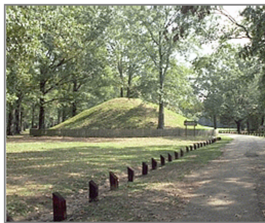
Montículo de la cultura Hopewell

Entonces comenzó la larga e inestimable relación de Squier con América Central y Suramérica que dio por resultado la acuñación de volúmenes que lograron reconocimiento académico. Hoy sabemos que sus trabajos sobre América Central estaban sesgados por sus intereses como diplomático, como empresario y como político interesado en promover el expansionismo del Destino Manifiesto. Cuando llegó a su fin la misión oficial de Mr. Squier el 13 de septiembre de 1850, ya era la más grande autori-