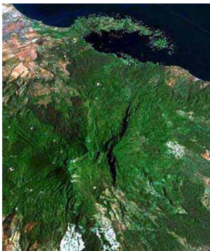
Las dos avalanchas dejaron sendos cicatrices en las faldas del volcán Mombacho: hacia el noreste (arriba en la imagen) Las Isletas; abajo El Cráter hacia el suroeste. Imagen de Google Earth desde una altura de 8.76 km

“Cuatro leguas de esta ciudad [Granada] estaba un pueblo de indios llamado