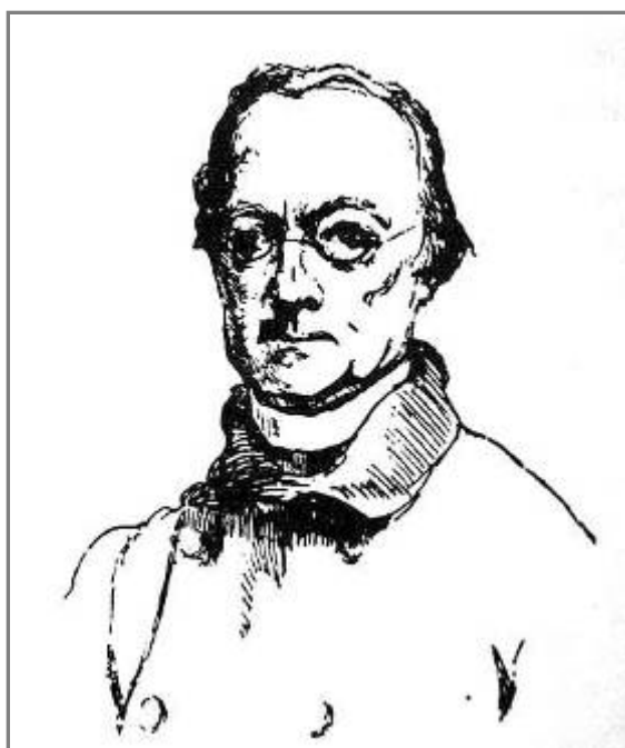
Abbé Charles-Étienne Brasseur de Bourbourg (1814 - 1874)

El padre Charles-Etienne Brasseur de Bourbourg (1814-1874), conocido como el Abate Brasseur es un personaje clave en los estudios precolombinos del área de México y Guatemala. Tuvo mucho interés en la historia de los indígenas de esta zona y aprendió el nahuatl, el quiché, el cachi-quel y el tzutuhil. El conjunto de su obra fue de mucha importancia para desarrollar en Francia un americanismo científico .