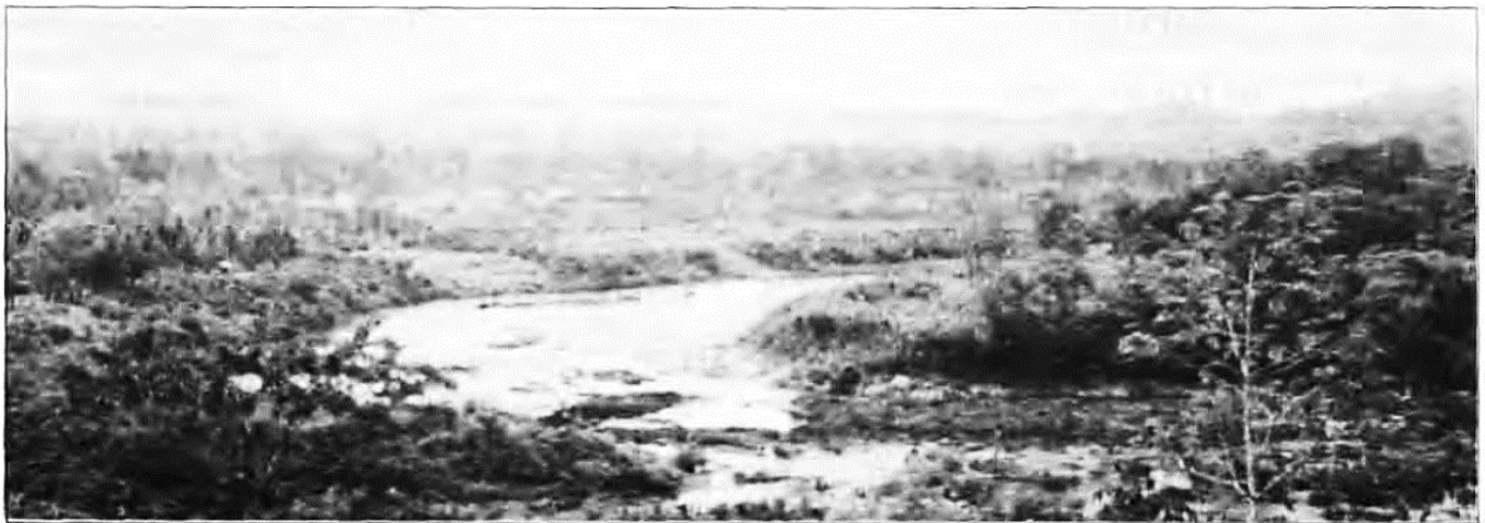
Río Coco arriba, zona de amortiguamiento de la Reserva.

La actual Reserva de la Biosfera BOSA WAS fue originalmente establecida por el gobierno de Nicaragua, mediante Decreto Ejecutivo No 44-91 del 29 de octubre de 1991 (La Gaceta N° 208, pp. 2114-2116, del 5 de noviembre de 1991), como Reserva Nacional de Recursos Naturales, con la finalidad expresa de preservar un reducto importante del bosque húmedo tropical de América Central; para asegurar la sobre vivencia y desarrollo cultural de los pueblos indígenas mayangna y miskito que habitan en ella; y para prevenir los efectos de la reactivación de la frontera agrícola y la explotación de los recursos forestales en cuanto estos factores "alterarían el equilibrio ecológico y la diversidad biológica de la zona." Adicionalmente, el decreto expresa preocupación por la biodiversidad