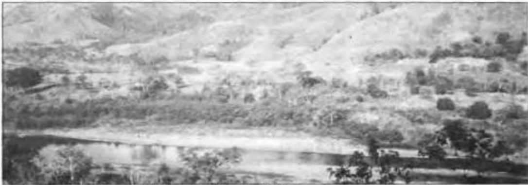
Río Coco arriba, zona de amortiguamiento de la Reserva.

Durante el período colonial también ocurrieron otras corrientes migratorias que han dejado impresa su marca en la composición étnica de la Nicaragua actual (Hurtado de Mendoza 1999). Los pocos garífunas que viven en la costa atlántica