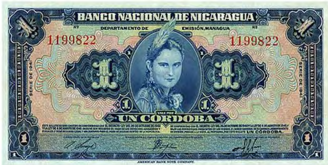
Billete de Un córdoba que se utilizó en Nicaragua durante el Gobierno del Gral. Anastasio Somoza García. El diseño estuvo a cargo de don Frutos Alegría.