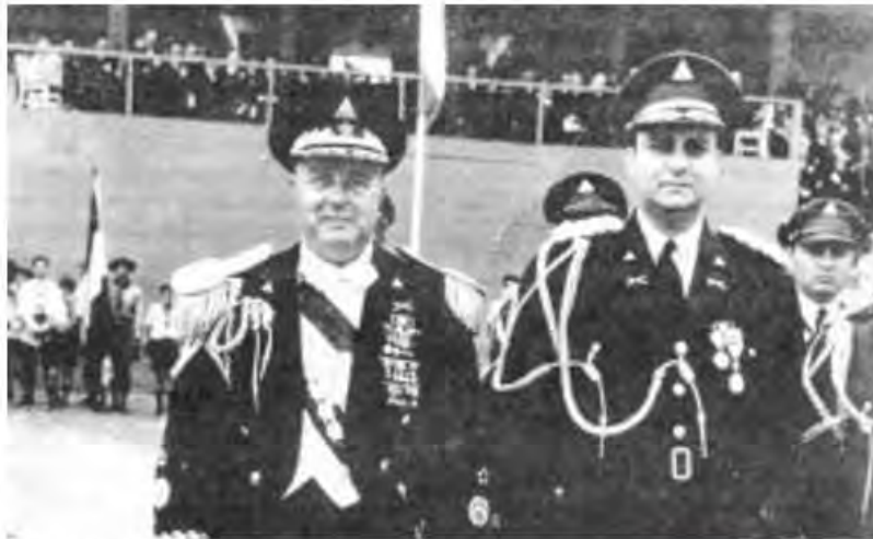
Anastasio Somoza García y Anastasio Somoza Debayle en Bogotá.

Román y Reyes, partidario de los Estados Unidos, toma numerosas medidas destinadas a proteger los intereses de ese país en Nicaragua, y por fin en abril de 1948, su gobierno es reconocido por el gran país del norte. Un pacto político entre Somoza García y Carlos Cuadra Pasos, líder del Partido Conservador, fija el término del período de Román y Reyes el 1º de mayo de 1951. El 21 de mayo de 1950