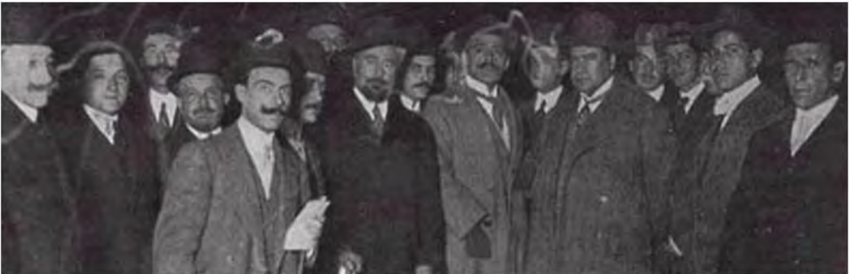
Darío (quinto de derecha) con amigos en Barcelona, 1912.