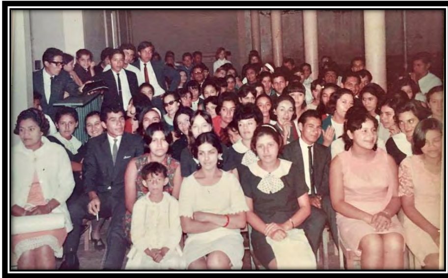
Estudiantes de la Escuela Normal de Jinotega