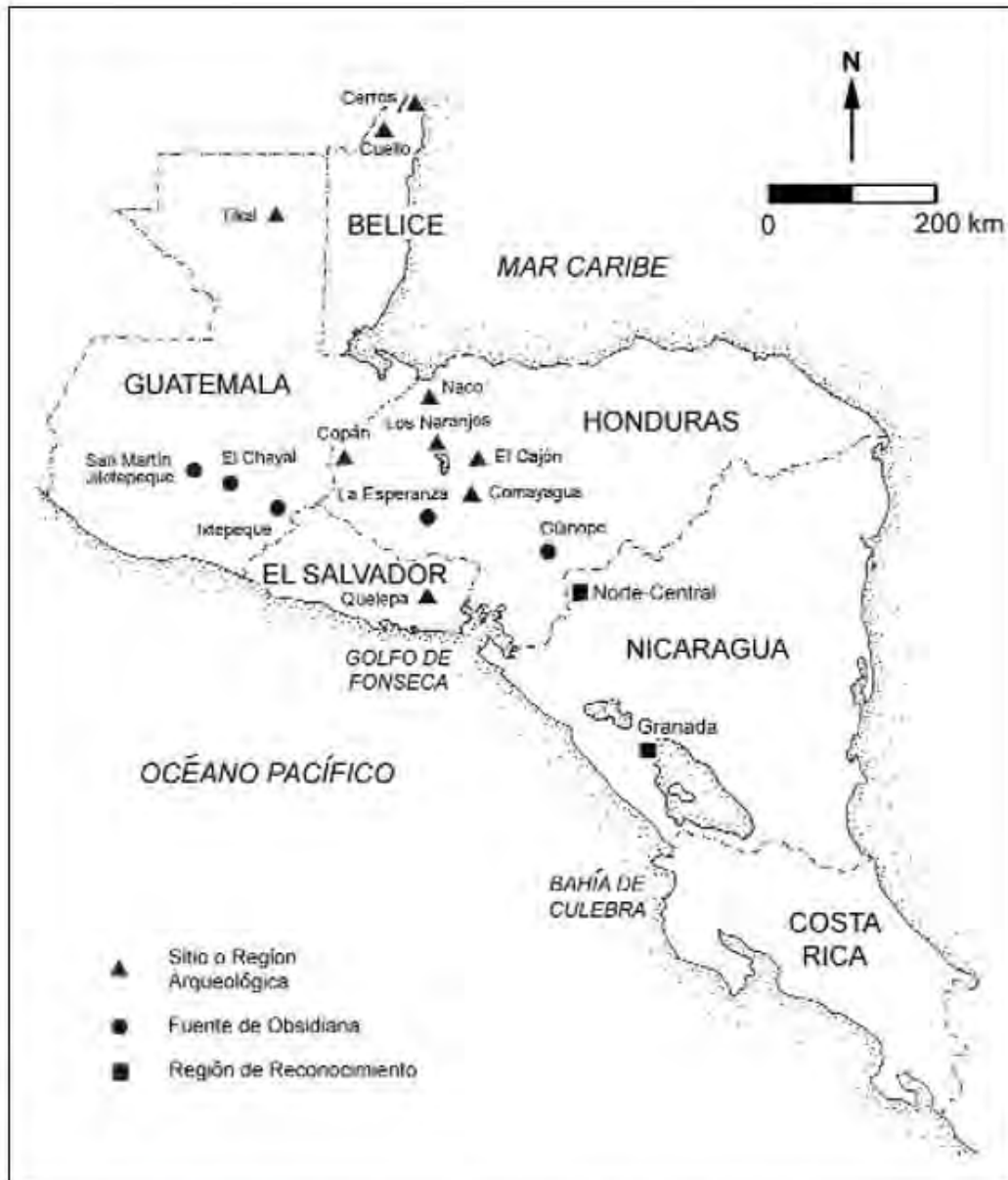
Figura 1. El Sudeste de Mesoamérica y la Gran Nicoya con la ubicación de los proyectos nicaragüenses, de sitios arqueológicos seleccionados y de las fuentes de obsidiana mencionadas en el texto.

Los dos proyectos que proporcionan datos sobre asentamiento, cerámica y lítica para nuestra discusión se llevaron a cabo en el departamento de Granada, ubicado en la costa noroeste del lago Nicaragua, y en los departamentos de Madriz y Estelí, en la región norte y central del país (Figura 1). Ambos proyectos consistieron en reconocimientos regionales cuyo objetivo fue determinar el patrón de asentamiento. La excavación de pozos de sondeo permitió la recuperación de colecciones cerámicas y líticas susceptibles de estudios adicionales. Este conjunto de datos se usó para elaborar inferencias sobre la organización socio-política de