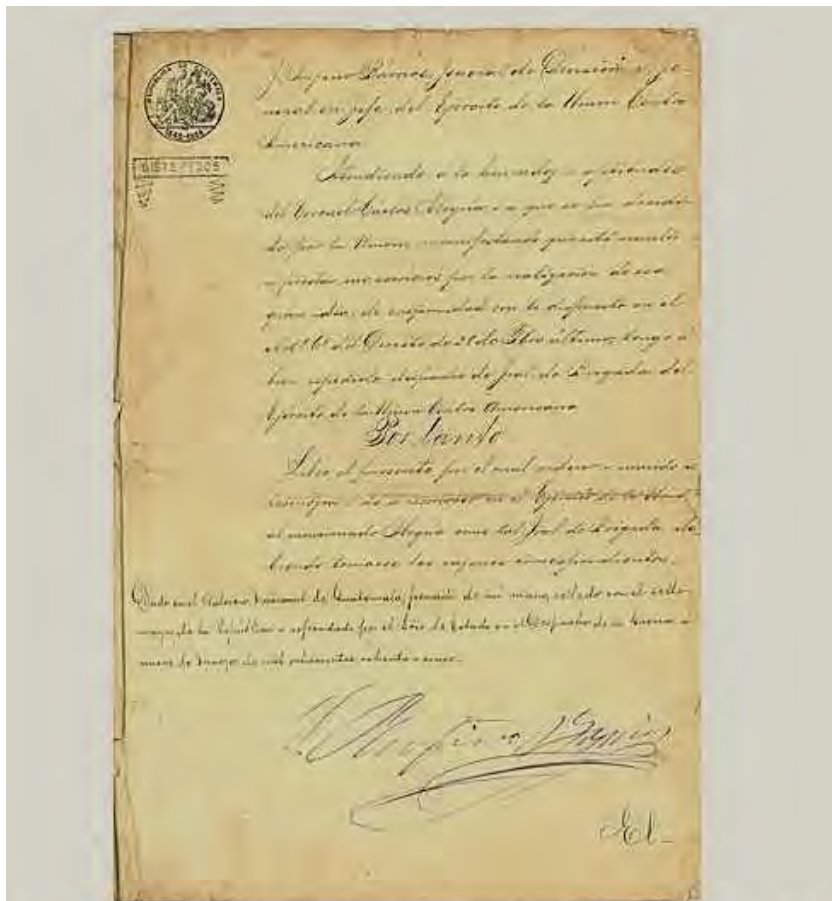
Nombramiento del Gral. Carlos Alegría como General de Brigada del Ejército de la Unión Centroamericana; por el General en Jefe, Justo Rufino Barrios; otorgado en el Palacio Nacional de La Antigua, Guatemala, el 9 de marzo de 1885. Fuente: Cortesía del arquitecto Alejandro Bermúdez Tablada, propietario del documento original.

Este ilustre personaje, indudablemente, inspiró su futura trascendencia nacional.