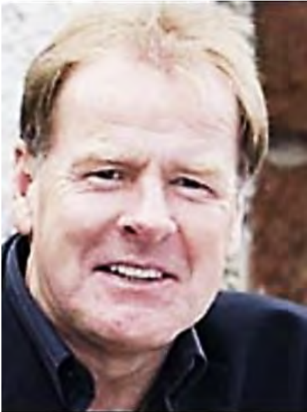
Murdo J. MacLeod

La traducción al español de este libro es MacLeod, Murdo J. Historia socioeconómica de la América Central española, 1520-1720 . Guatemala: Editorial Piedra Santa, 1980.