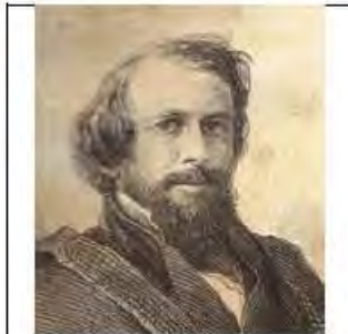
Fig. N°4 Ephraim G. Squier (1821-1888)