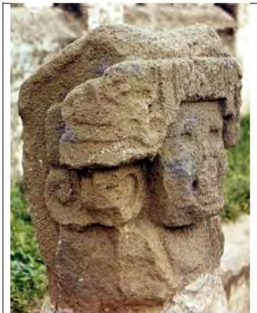
Fig. N° 5 Escultura 207, de tipo busto-collar, originaria de Altagracia (Om-48), muestra desgaste en su extremo superior.

aspecto antropomorfo, erosionada y sin huellas de trabajo dejadas por instrumentos metálicos. Lo anterior contrasta con la decoración inferior alusiva a las decoraciones barrocas que se colocan en la arquitectura europea. En esta última se puede observar técnicas de talla post coloniales y poca erosión superficial.