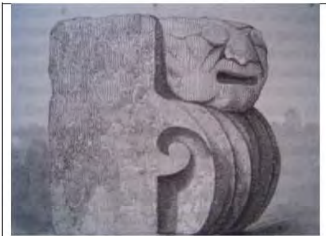
Fig. N° 2 Dibujo de James Mc. Donough, en Squier (1852)

En el dibujo de Squier (1852), se observan ojos cerrados y rasgados, así como una nariz gruesa y aplanada, (Figura N° 2).