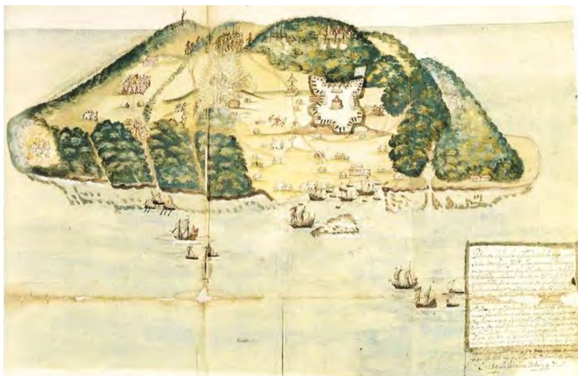
Dibujo de Tortuga en el siglo XVII.