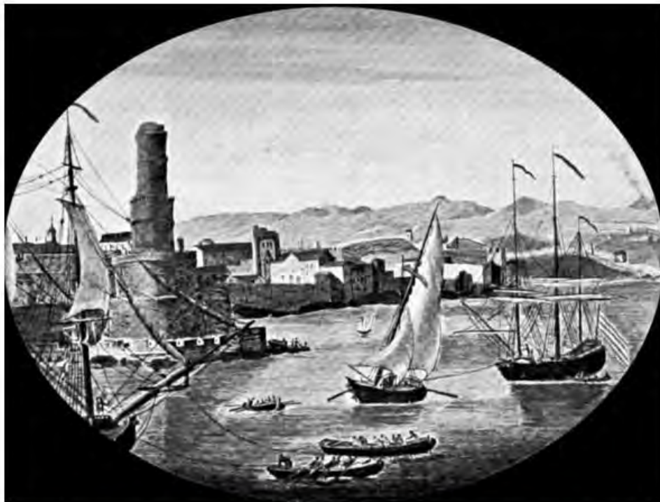
Port Royal antes de 1692.

los corsarios patrocinados por los ingleses y holandeses para gastar su tesoro durante el siglo XVII. Cuando esos gobiernos abandonaron la práctica de emitir patentes de corsario contra las flotas y posesiones de tesoros españoles en el siglo XVI, muchas de las tripulaciones se convirtieron en piratas. Continuaron usando la ciudad como su base principal durante el siglo XVII. Piratas de todo el mundo se congregaban en Port Royal, procedentes de aguas tan lejanas como Madagascar. Después del desastre de 1692, el papel comercial de Port Royal fue asumido por la ciudad de Kingston. Recientemente (1999) se ha tratado de reconstruir la actual ciudad pesquera de Port Royal como destino para servir a los barcos de cruceros. Podría capitalizar su patrimonio único, con los hallazgos arqueológicos de los años pre-coloniales y corsarios como base de posibles atracciones.