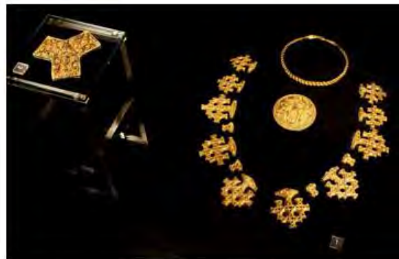
Izquierda: Una réplica de la original perdido del cofre de Cammin, un pequeño relicario dorado de finales del período Vikingo en el estilo Mammen (Nationalmuseet). Derecha: Joyas de oro del siglo X, tesoro de Hiddense, mezcla de símbolos nórdicos paganos y cristianos. Fuente: Wikipedia. Viking art

Los vikingos fueron el azote de Europa, al igual que se dice que los piratas fueron el azote en muchas colonias españolas. Se suele olvidar el aporte cultural