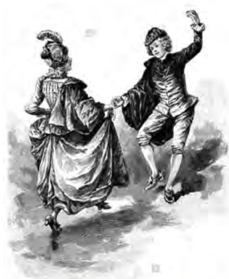
Sarabande, dance, baroque music, woodcut, 1888, historic engraving.

En Bailes eróticos en la España Moderna se dice que «la zarabanda instrumental es una versión domesticada de una danza intensamente erótica que floreció en España y algunas partes de Hispanoamérica a finales del s. XVI y principios del s. XVII. La primitiva zarabanda era un baile cantado, muy criticado por los moralistas y las autoridades debido a su supuesta obscenidad, lo que tuvo entre otras consecuencias que un poeta fuera perseguido por la Inquisición en México (1569) y que el baile se prohibiera en España (1583 y 1615). El historiador Mariana escribió en 1609 un capítulo entero censurando la perversión de la zarabanda, a la que se refirió Cervantes en 1613 como “el endemoniado son de la zarabanda” y Marino como “oscena danza” en L’Adone (1623) . A pesar de su mala reputación, los investigadores no han conseguido todavía dar una explicación convincente del carácter subversivo de la zarabanda primitiva. Entre los pocos