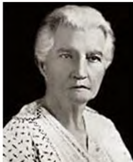
Josefa Toledo de Aguerri