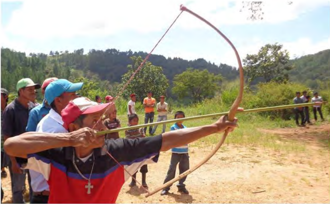
Pobladores de Yúcul, San Ramón, Matagalpa. En el torneo de tiro con arco, durante la conmemoración de la participación de sus ancestros flecharon en la batalla de San Jacinto, en septiembre de 2016.

la casta indígena la encontramos en la Memoria del Ministerio de Instrucción Pública del año 1925.