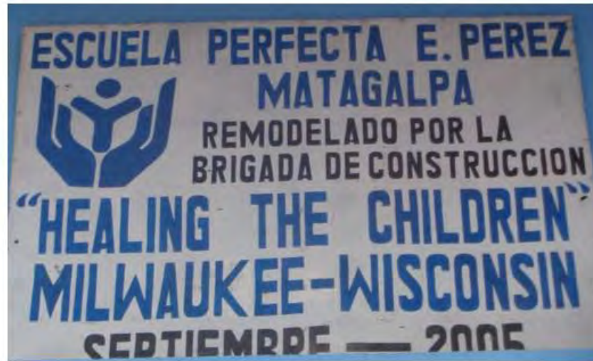
Rótulo de la entrada de la Escuela Perfecta E. Pérez, ubicada 1c. al norte del teatro Municipal

Con las informaciones precedentes de la escuela normal para indígenas de Matagalpa, estamos frente a un experimento fallido que, si bien pretendía sacar del analfabetismo a la casta indígena, también establecía un instrumento que, disfrazado de ayuda para mejorar sus vidas, en realidad se pretendía el control de las conciencias y reivindicaciones de la casta indígena. El discurso de los funcionarios de la época adolece de nociones de respeto por la cultura y las tradiciones étnicas locales, ya que se les consideraba perezosos, faltos de moral y llenos de supersticiones.