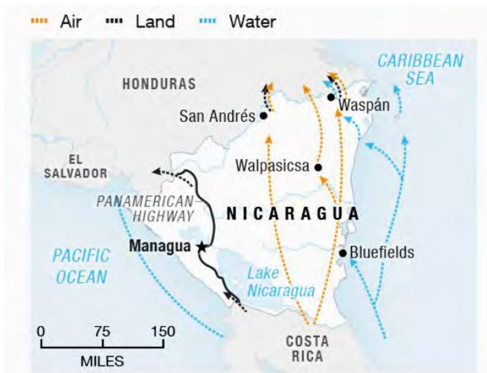
Source: United Nations Office on Drugs and Crime: “Transnational Organized Crime in Central America and the Caribbean” (September 2012) Credit: Alyson Hurt / NPR

Estamos en la ruta del narcotráfico porque América del Sur es el único productor de cocaína para el mercado mundial. México y los países del Caribe son la principal fuente de marihuana que consumen los estadounidenses. México y Colombia son las principales fuentes de opiáceos para los Estados Unidos; y México la principal fuente de metanfetamina extranjera que se consume en los Estados Unidos. Nicaragua es uno de los países involucrado en este comercio y sufre las consecuencias.