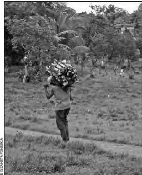
Comunidad El Carrizal, territorio indígena Li Lamni Tasbaika Kum, Julio 2009.

Por ejemplo, buscando una solución para la mayoría de los colonos, el pueblo indígena rama y las comunidades kriol han elaborado desde hace varios años "La Guía de Convivencia