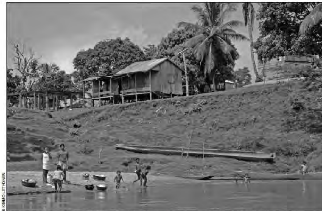
Ninguno de los territorios titulados ha avanzado en la etapa de saneamiento. Comunidad miskita de Río Coco.

Junto a la definición que establece el Arto. 3, de la Ley No. 445, sobre quién es “tercero” en tierras indígenas: “Personas naturales o jurídicas, distintas de las comunidades, que aleguen derechos de propiedad dentro de una tierra comunal o un territorio indígena”, cada comunidad indígena o afro descendiente tiene complementariamente el derecho a determinar, en asamblea comunitaria o territorial de conformidad con sus costumbres y tradiciones, el estatus de cada uno de sus miembros y de los terceros dentro de su ámbito territorial.