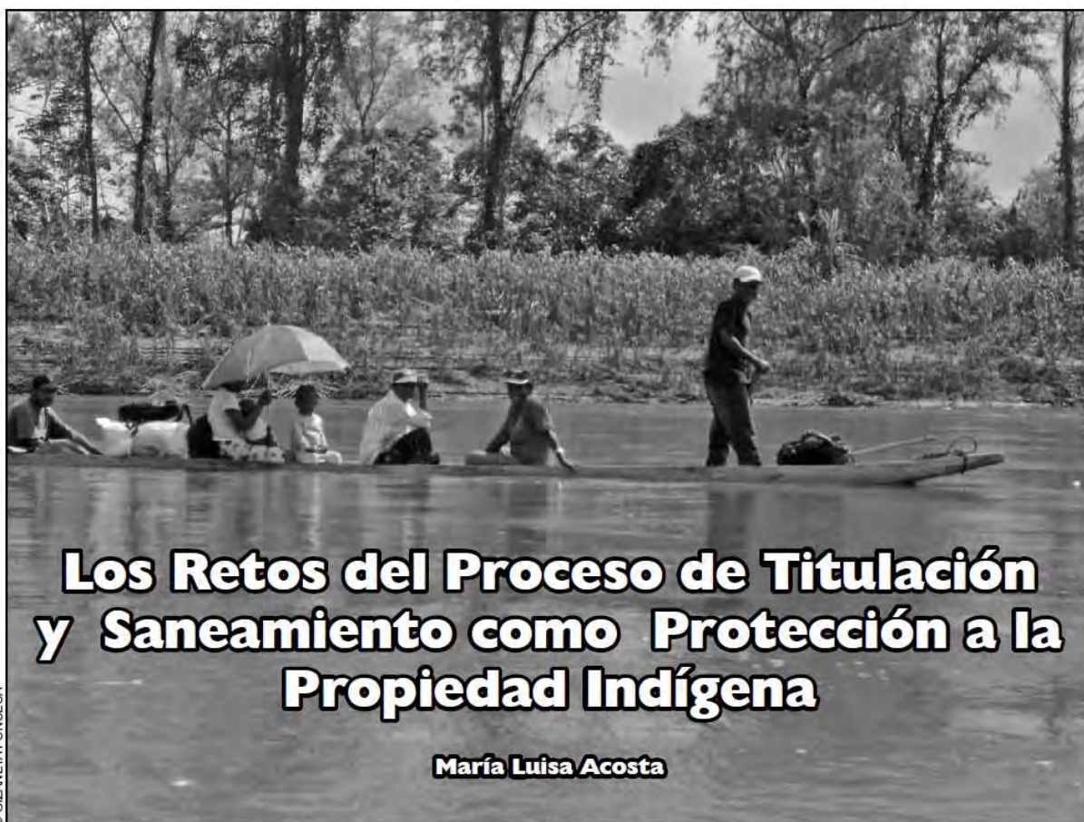
Territorio indígena Li Lamni Tasbaika Kum, cuenca media del Río Coco, 2009.

Reproducido de WANI 60: 5-17, 2010. La numeración de las notas está interrumpida porque la No. 16 y No. 17 están en figuras; por ello hemos agregado al secuencia de notas, una nota X para respetar la secuencia original.