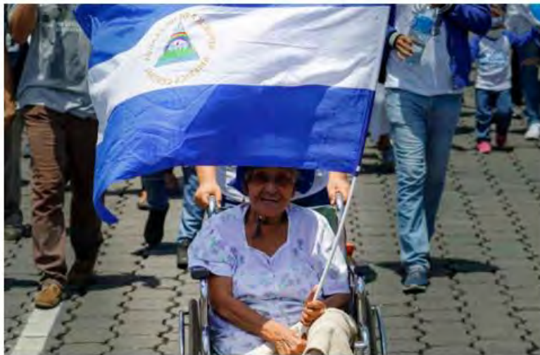
Anciana en silla de ruedas participa en todas las marchas contra el gobierno tiránico.

El gobierno de los federalistas bajo Juan Manuel Rosas ((Buenos Aires, 30 de marzo de 1793–Southampton, 14 de marzo de 1877) en su primer período fue respetado, aunque sólo tres años. Su gobierno, asistido por Juan Facundo Quiroga y Estanislao López, gobernadores de La Rioja y Santa Fe, respectivamente, fue respetado y Rosas fue halagado por su habilidad de mantener la armonía entre Buenos Aires y las zonas rurales. El país cayó en el caos luego de la dimisión de Rosas en 1832, y en 1835 fue convocado nuevamente para gobernar la provincia. En esta ocasión, regresó con un gobierno más autoritario, obligando a todos los ciudadanos a apoyar su gobierno, utilizando el eslogan "¡¡Viva la Santa Federación, mueran los salvajes unitarios!!". Según Nicolas Shumway, Rosas «obligó a los ciudadanos a usar la insignia roja de los federales, y su imagen apareció en todos los lugares públicos... los enemigos de Rosas, reales e imaginarios, fueron encarcelados, asesinados o llevados al exilio por la mazorca, una banda de espías y matones supervisados personalmente por Rosas. La publicación fue censurada, y los periódicos porteños se vieron obligados a defender el régimen»