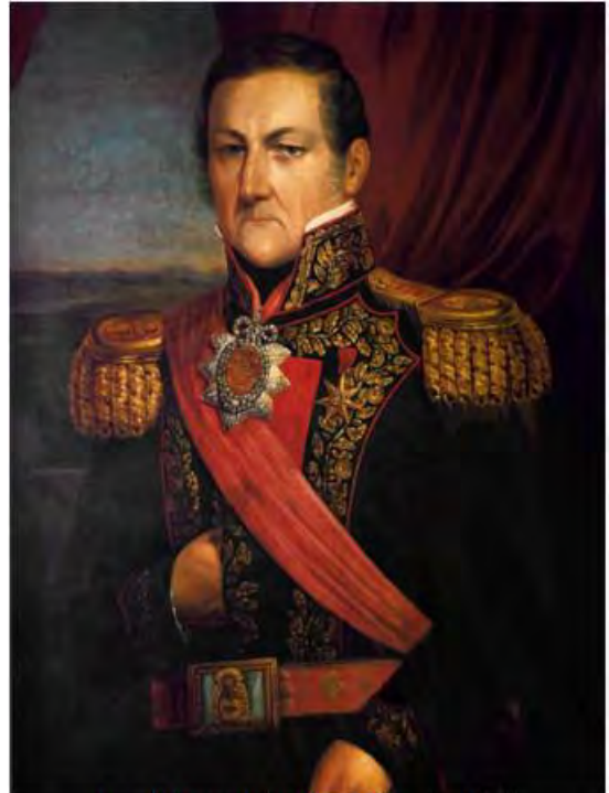
Juan Manuel de Rosas hacia 1850.