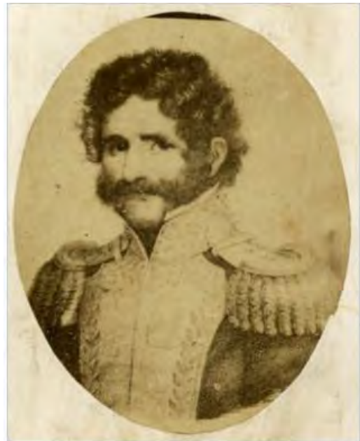
Juan Facundo Quiroga. Como personaje principal de Facundo representa a la barbarie que es la antítesis de la civilización.

Uso de título Civilización i Barbarie de la obra de Domingo Faustino Sarmiento, porque analiza los conflictos que surgieron en Argentina una vez alcanzada la Independencia política en 1816, partiendo de la antinomia entre civilización y barbarie. El Dialogo Nacional es la salida civilizada, el gobierno ha