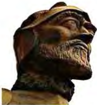
Cabeza de la estatua de Pedrarias erigida en Panamá.

Historiador, graduado Univ. Danmarks Lærerhøjskole, profesor jubilado, dueño de la mejor colección de libros de historia de Nicaragua en Dinamarca