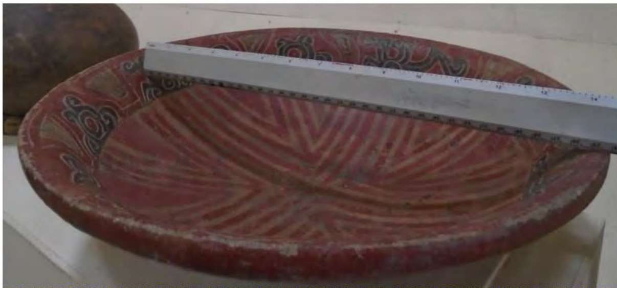
Plato tipo Bocana de 7" diámetro