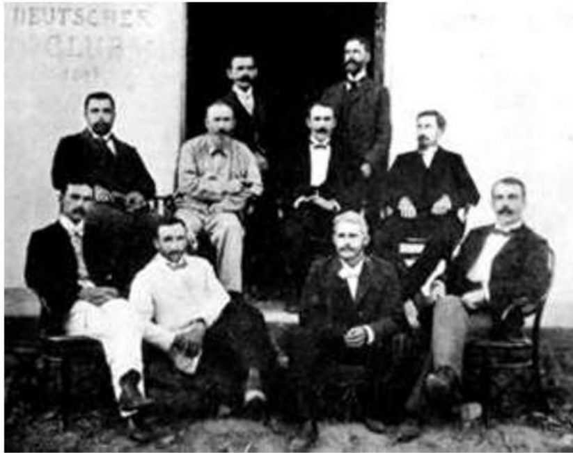
Club se Alemanes en Matagalpa

Muchos de los extranjeros que vivieron en Matagalpa no aparecen en la lista por alguna de las razones siguientes: