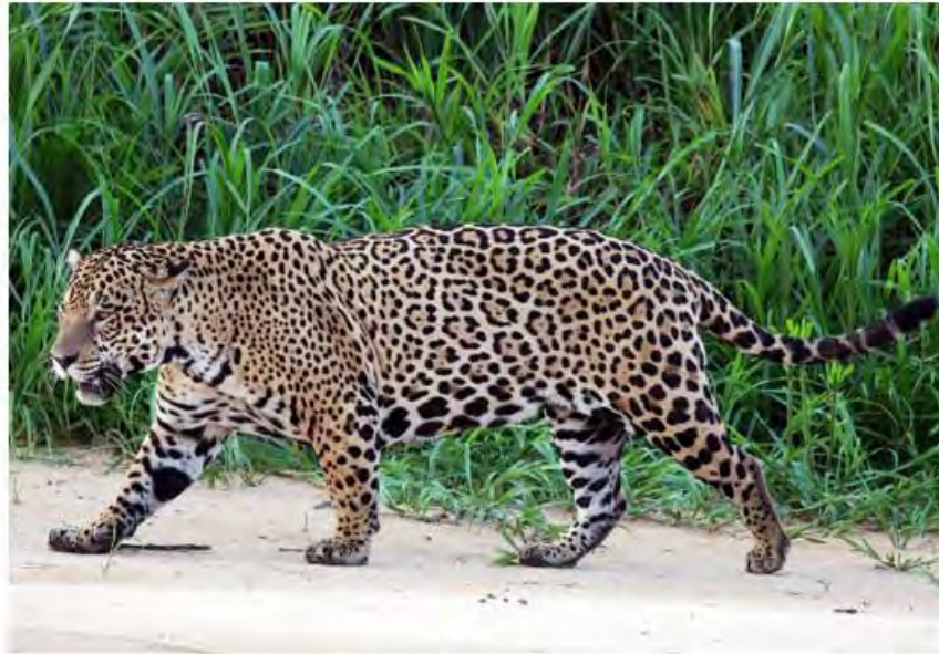
Jaguar macho ( Panthera onca )

Entre los mamíferos se destaca la presencia de las especies de mayor tamaño y que requieren de grandes zonas boscosas. Así pues el jaguar, el puma, el tapir o danto y posiblemente el oso hormiguero están presentes en el bosque, también hay otras especies de mamíferos como los monos y los murciélagos. Se