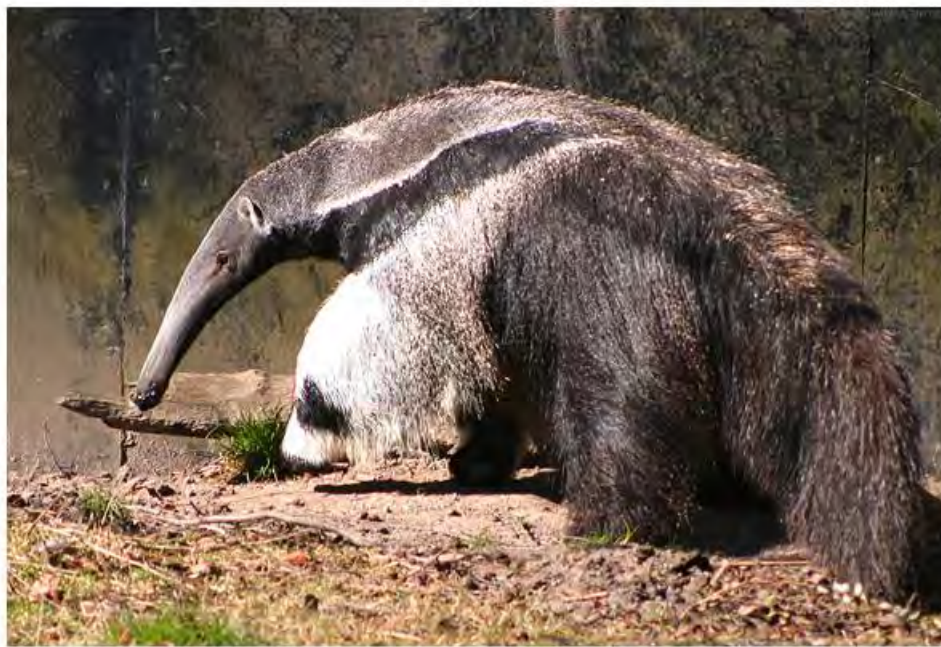
Oso hormiguero gigante ( Myrmecophaga tridactyla )

los siguientes: Bosque perennifolio estacional ribereño, Bosque perennifolio bien drenado, Bosque perennifolio pantanoso de palmas, Sistemas agropecuarios con un 10-50% de vegetación, Sabana anegada con árboles y palmas, Sabana anegada con pinos, Manglar, Laguna costero aluvial, Estuario abierto, Humedal.