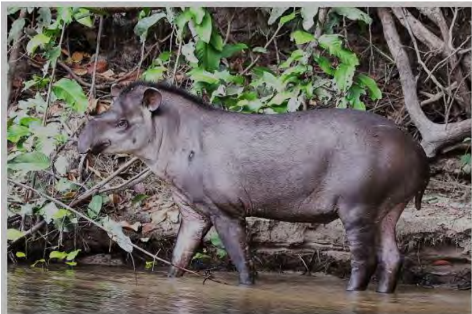
Tapir o danto ( Tapirus bairdii Gill, 1865)

Entre los mamíferos se destaca la presencia de las especies de mayor tamaño y que requieren de grandes zonas boscosas. Así pues el jaguar, el puma, el tapir o danto y posiblemente el oso hormiguero están presentes en el bosque, también hay otras especies de mamíferos como los monos y los murciélagos. Se