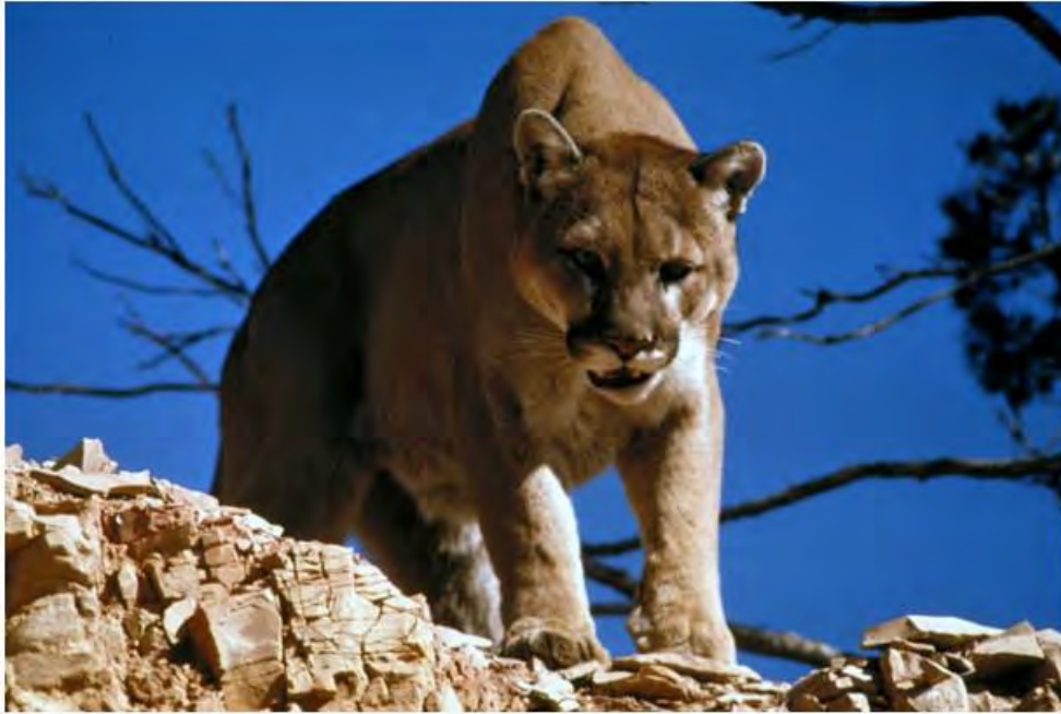
Puma, león de montaña, león americano ( Puma concolor )

características son muy poco comunes y la importancia de especies tanto animales como vegetales de ambas Américas es mayor, así como su uso por las poblaciones divagantes de aves en varias épocas del año.