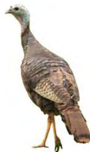
Hembra de pavo silvestre

Cuando es época de reproducción los machos fijan territorios, los grupos de hembras se desarticulan, provocando que las hembras transiten solitarias con total libertad por los territorios, los machos que han conseguido fijar su dominio sobre un territorio tratan de atraer hembras con llamadas sonoras y realizando movimientos complejos, en grupos de machos jóvenes solo el más dominante es el que se aparea, comúnmente un grupo pequeño de machos dominantes tiene total dominio sobre un gran número de individuos, cuando el macho y la hembra han consumado el acto sexual empiezan la construcción del nido pudiéndose aparear diariamente hasta el momento de empollar, por lo regular las hembras forman grupos para nidificar y criar a sus pavitos en el mismo nido, la madre pavo depositara de 5 a 8 huevos y los empollará alrededor de 28 días, acto seguido los polluelos permanecerán en el nido hasta los 6 o 7 meses. Si el apareamiento no provoca el nacimiento de crías las hembras forman pavadas sin nidada. En el invierno los machos y las hembras se separan formando "pavadas invernales", los polluelos machos abandonan el nido y forman sus propias "pavadas invernales".