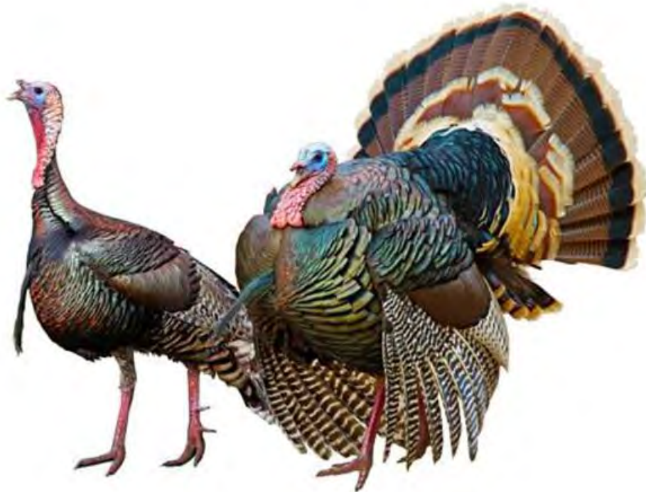
Macho de pavo doméstico: derecha en cortejo; izquierda en actus normal.

Es originario de América del Norte, pero se ha introducido como ave doméstica en casi todo el mundo. Su población al momento de la llegada de los