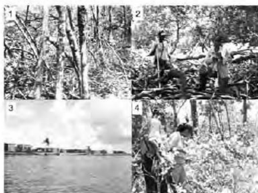
Figura 3. Bosques de manglares en cuatro sitios de estudio en los Cayos Perlas. Los números en la figura corresponden a la cada una de las cuatro zonas de estudio. Zona 1, Baboon Cay; Zona 2 Askill Cay; Zona 3 Seal Cay y Zona 4 Columbilla Cay.

Para el establecimiento de las parcelas permanentes procedimos a realizar recorridos de reconocimientos en los cayos que constituyen las cuatro zonas de estudio con el objetivo de determinar sitios óptimos para el establecimiento de las parcelas. Una vez seleccionado el sitio se establecieron dos parcelas permanentes de muestreo de 10x10 m- en cada uno de los cayos. Una parcela a un metro de la orilla de la playa y a 20 metros. Las parcelas fueron delimitadas con tubos de PVC y se utilizó pintura roja para pintar las puntas de los tubos y los árboles ubicados inmediatos al borde de la parcela. La localización de las parcelas se realizó utilizando sistemas de posicionamiento global (GPS). Todos los individuos con tallas a partir de 10 cm a la altura del pecho fueron etiquetados con una placa alumínica designada con un número único. Para medir el diámetro a la altura del pecho de especies de tallos múltiples, procedimos a seleccionar el tallo más grueso, al que se le midió el diámetro a la altura del pecho (1.37 m).