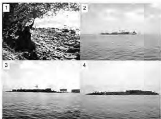
Figura 2. Sitios de estudio de ecosistema manglar en los Cayos Perlas. Los números en la figura corresponden a la cada una de las cuatro zonas de estudio. Zona 1, Baboon Cay; Zona 2 Askill Cay; Zona 3 Seal Cay y Zona 4 Columbilla Cay.