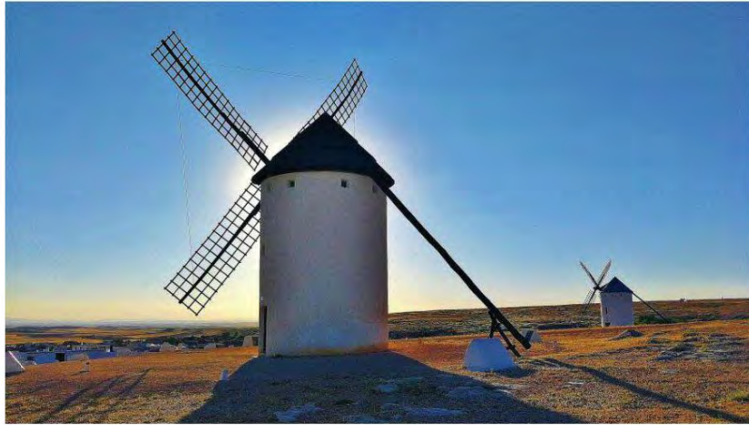
Molinos de viento en Campo de Criptana en Castilla-La Mancha

Para las características del molino manchego 3 , cuyas aspas tienen un radio ( r = 8,2 \text{ m} ), y a la velocidad del viento de 7 \text{ m/s} , la potencia generada, según la fórmula Betz, debería ser 26.300 \text{ W} . La diferencia hasta 14,720 viene provocada por las pérdidas e inadecuaciones de la velocidad del viento a la máquina. De hecho estudios experimentales realizados por el Laboratorio Eiffel en 1983, evalúan la potencia más alta generada por un molino de viento, no en el 59,2\% de la máxima, sino en el entorno del 30 \% , según las características de cada modelo, según la fórmula: