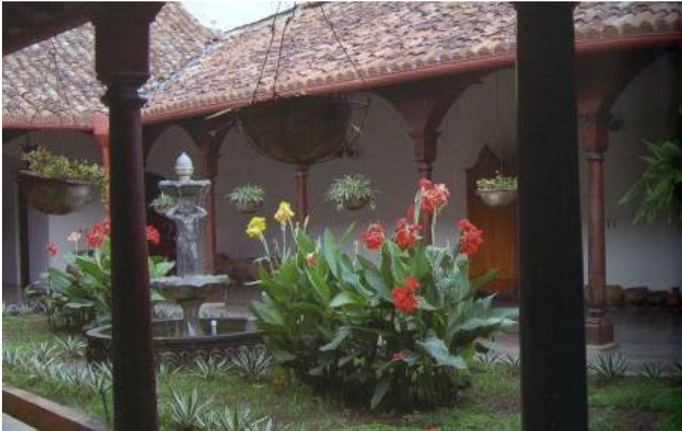
Jardín y corredores granadinos, de Nicaragua.

y candado, daba a la calle, pero permanecía en esas ocasiones abiertas de par en par a la luz crepuscular que detallaba como en un lienzo de Renoir a la familia ufana de placidez. Por anticipado Do-