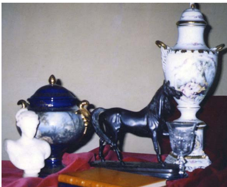
Objetos de arte de la colección Zepeda-Henríquez-Aguilar

http://www.asochispanonica.es/Paginas/Que%20Hacemos/Que%20Hacemos.html