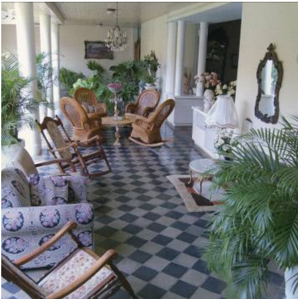
Sala y corredor granadino, de Nicaragua.